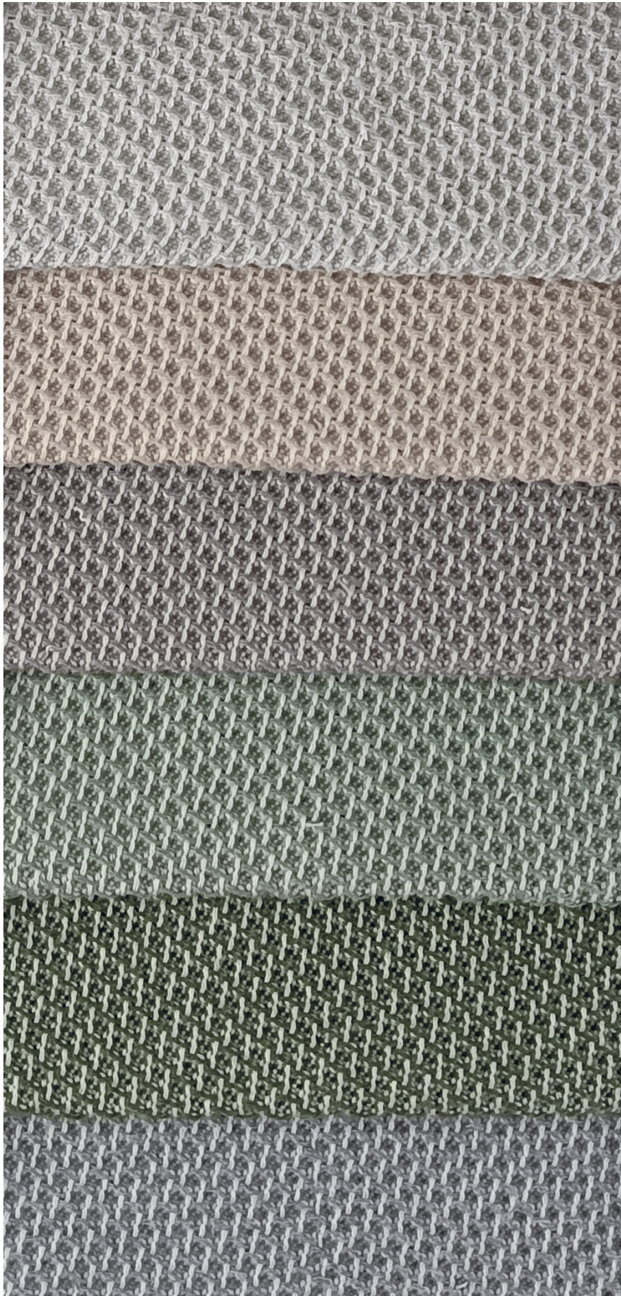
7971 grigio chiaro mélange